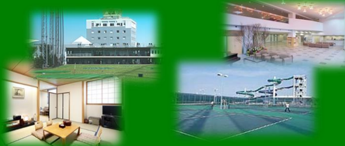
宿泊施設・テニスコート風景